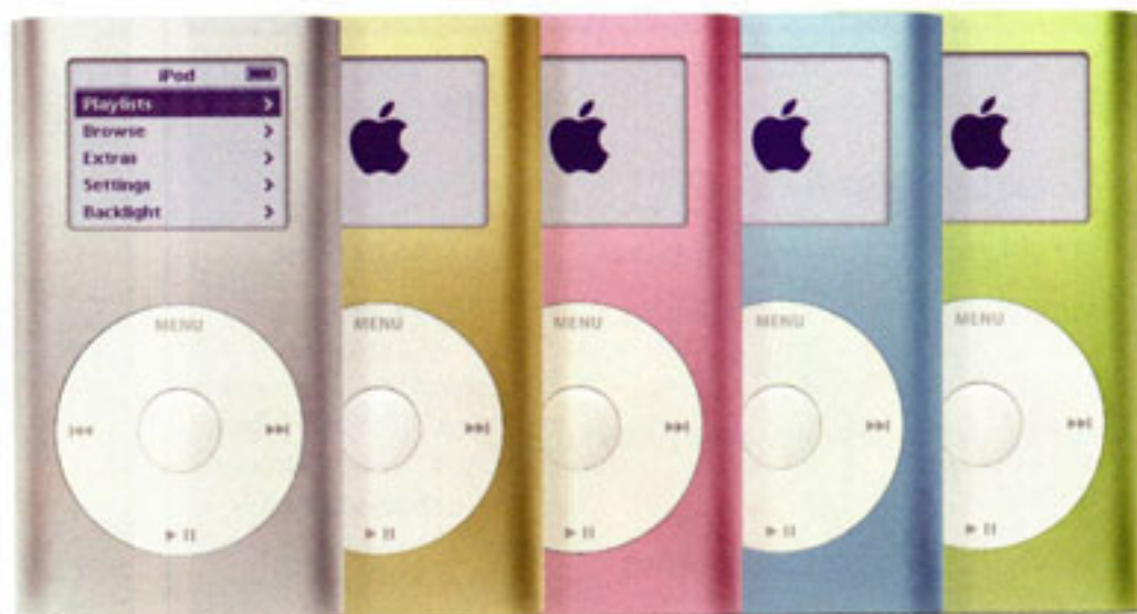
O mini iPod da Apple está disponível em cinco cores diferentes

qualquer informação adicional o leitor pode dar um saltinho ao site www.apple.com/products .